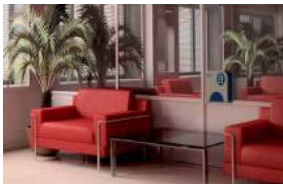
SALA ATTESA MEDICI SALA ATTESA PROFESSIONISTI