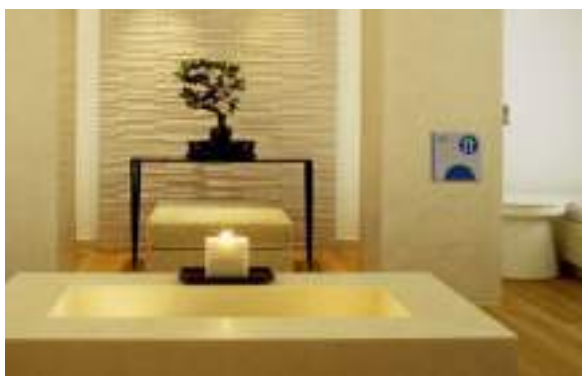
HOTEL SPA RSA