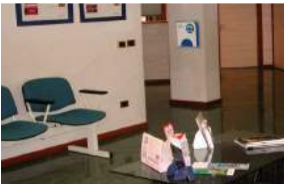
UFFICI SALE RIUNIONI SALE ATTESA